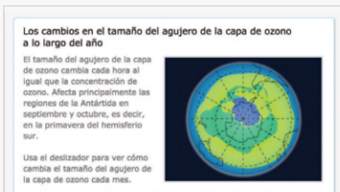
Mapas e infografías