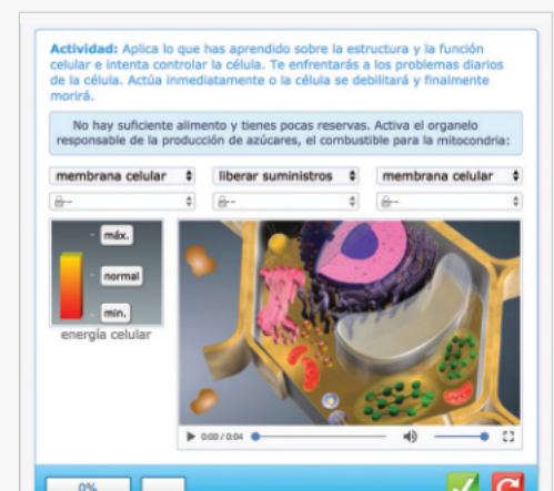
Múltiples y variados tipos de actividades