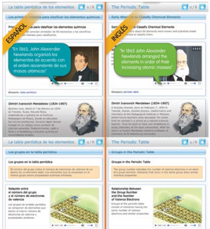
Ejemplo de lección en inglés y español

El funcionamiento del cerebro de una persona bilingüe funciona como un semáforo, determina el idioma que se está utilizando y da luz verde a ese idioma frenando el uso de la segunda lengua. Todo este proceso se da de forma natural y casi involuntaria.